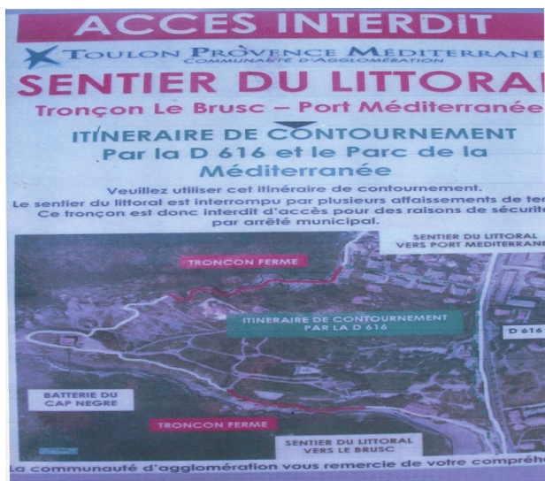
A Six Fours

A l'origine ces sentiers étaient de la responsabilité de l'Etat, depuis, la maîtrise d'ouvrage et la gestion des opérations a été reprise par TPM qui investi plus d'un million d'euros par an en études et en travaux.